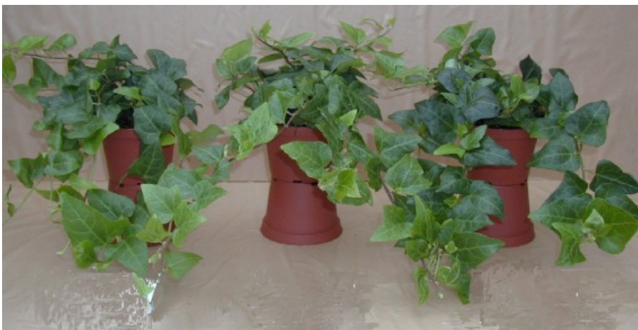
Hedera dyrket ved forskellige klimastyringer i forårsperioden. Forsøgsperiode 17/4-25/5-00. Fra venstre mod højre ses planter dyrket ved hhv. standardklima (Beh. 1), 90 % fotosyntese med 15°C som basistemperatur (Beh. 3) og 80 % fotosyntese med 15°C som basistemperatur (Beh. 2). Billedet er taget d. 29/5-00

I forsøgs perioden har der ikke været observeret specielle problemer med hensyn til hverken skadedyr eller sygdomme i de dynamisk styrede planter. Med baggrund i dynamikken kunne man forvente problemer med kondensering på bladene, og deraf følgende problemer med sygdomme. Det har ikke været tilfældet og kan skyldes at de ændringer der er i temperaturen sker langsomt, og at kondensering derfor kun sker på væksthushets glas og således ikke på planterne. I fremtiden skal der arbejdes videre med denne problemstilling.